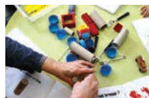
MÉDIATHÈQUE P. 23 Expérience créative