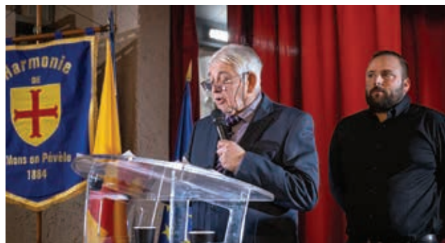
Les élus ont pu présenter les réalisations 2023.