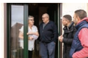
COLIS DES AÎNÉS P. 10 Un moment attendu