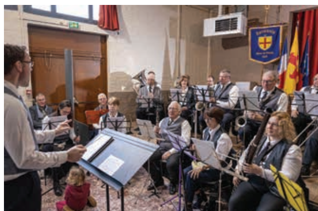
Comme à son habitude, l'Harmonie de Mons-En-Pévèle a assuré l'ambiance de la cérémonie des vœux.