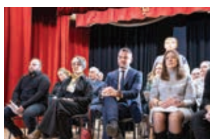
VOTRE COMMUNE P. 08 Cérémonie des vœux

Votre magazine d'informations municipales