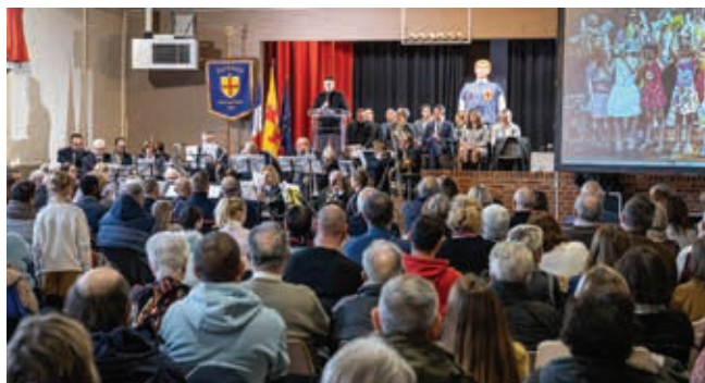
La cérémonie des vœux a eu lieu le 14 janvier.