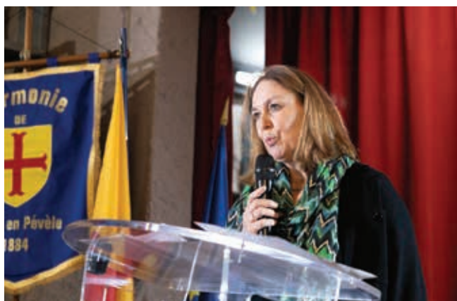
Les associations ont été mises à l'honneur.