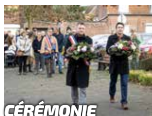
CÉRÉMONIE 11 novembre

Votre magazine d'informations municipales