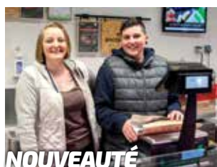
NOUVEAUTÉ Carrefour Contact