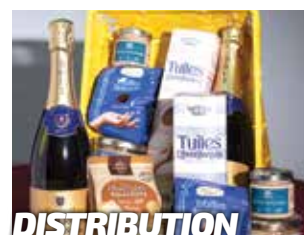
DISTRIBUTION Colis des aînés