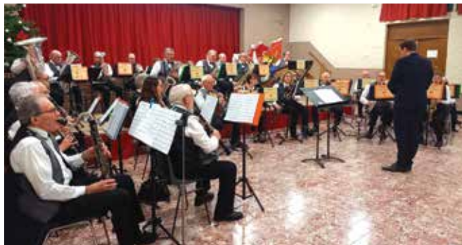
Concert au profit du téléthon du 24 novembre