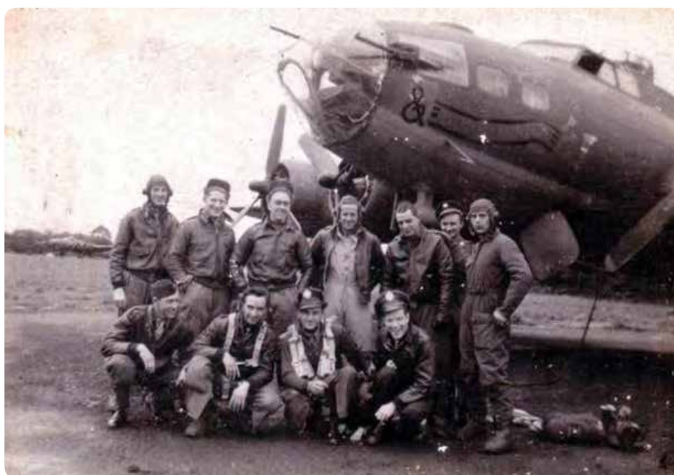
Après avoir sauté en parachutes, les membres de l'équipage de la forteresse volante abattue dans le ciel de Mons-en-Pévèle ont connu des fortunes diverses...