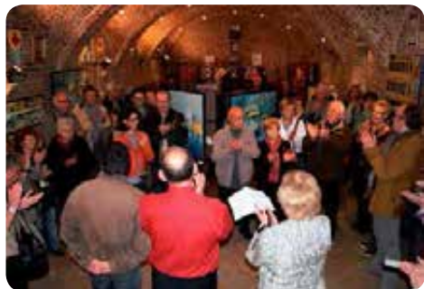
Vernissage de l'exposition "Quatre artistes à la Cense abbatiale" en avril