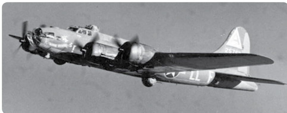
La forteresse volante abattue par les Allemands au dessus de Mons-en-Pévèle en 1943