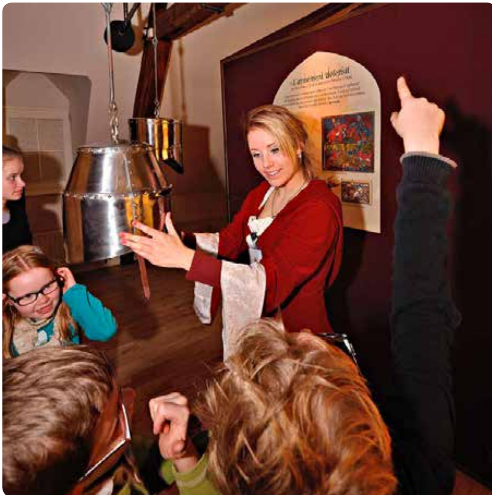
Plébiscité par les grands mais aussi par les petits, pour son aspect ludique, notre Musée a déjà reçu 2000 visiteurs !