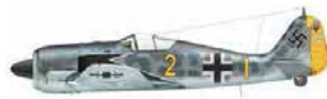
Le chasseur allemand ayant abattu l'avion Américain appartenait à la Jagdgeschwader 2 (JG 2) (2 e escadron de chasseurs), surnommée Richthofen (Evreux).