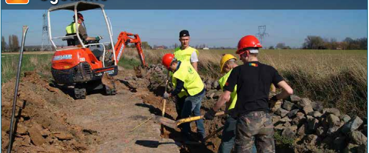
Les travaux des Amis de Paris-Roubaix contribuent à valoriser des chemins de promenade et à sécuriser le passage des coureurs