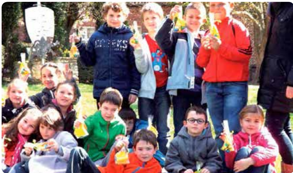
Chasse aux œufs au jardin public