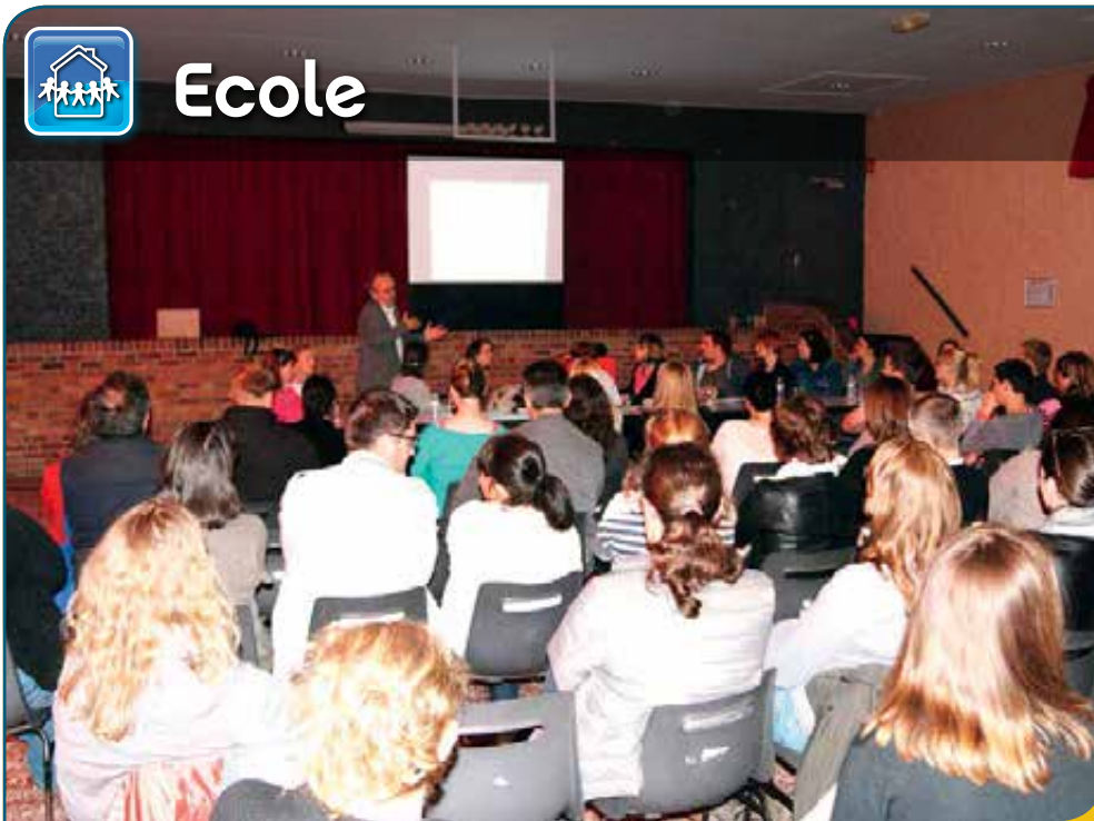
Pendant plus d'un an, le comité de pilotage a travaillé, en concertation, pour finaliser le projet