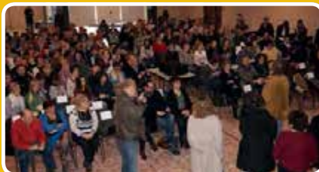
Dans une salle des fêtes comble pour l'occasion, les Pévélois étaient impatients de découvrir leurs lieux de vie à l'écran

Et, à la lecture du petit mot déposé par le réalisateur (sur le site de Plus belle la vie) à l'attention des habitants de Mons-en-Pévèle (lire ci-contre), on ne doute pas que, loin du soleil de Marseille, les membres de l'équipe aient trouvé la chaleur du Nord.