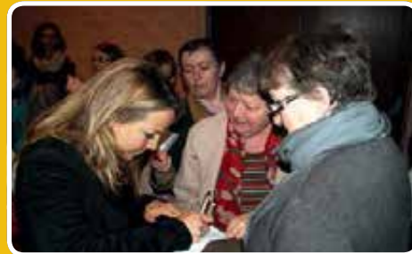
Bain de foule et séance d'autographes pour Aurélie VANECK