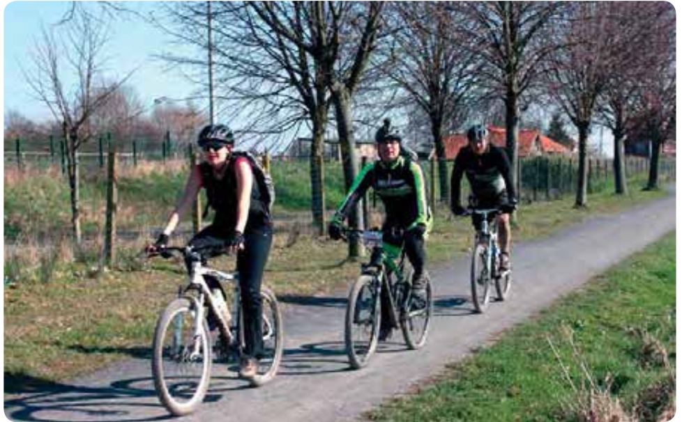
Retrouvez toutes les photos de la journée sur la page facebook https://www.facebook.com/pages/Transp%C3%A9v%C3%A8loise-Classic/578153788918130

Le 16 mars dernier, notre commune s'est vu envahir le temps d'une matinée par 1250 cyclistes venus des 4 coins de la région mais aussi de Belgique. En effet, le Team VTT Pays de Pévèle a, à nouveau, animé le village fort des quarante bénévoles venus mettre la main à la pâte ce jour là. Si on ne peut nier la qualité des organisateurs et leur dévouement durant tout le week-end, on doit aussi mettre en avant deux points importants qui ont aidé à la réussite de cette journée. Il y a d'abord l'attractivité qu'exerce notre belle commune sur les cyclistes ; on a l'impression d'un aimant qui chaque week-end attire à lui indéniablement les cyclistes qui veulent gravir le mont. Ensuite on ne peut ignorer dans la réussite de cette journée l'incroyable météo pour un mois de mars : peut-être que cette manifestation a été bénie des Dieux du cyclisme dès sa première édition.