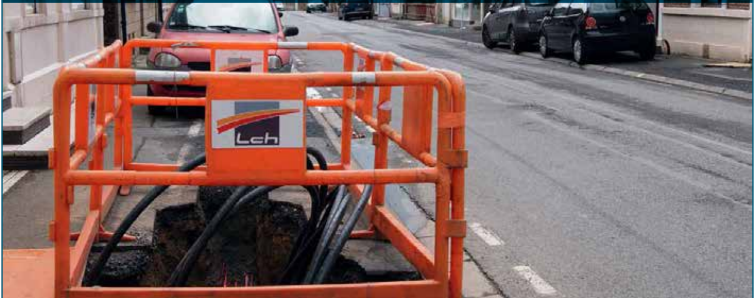
Travaux d'enfouissement des réseaux rue du Moulin